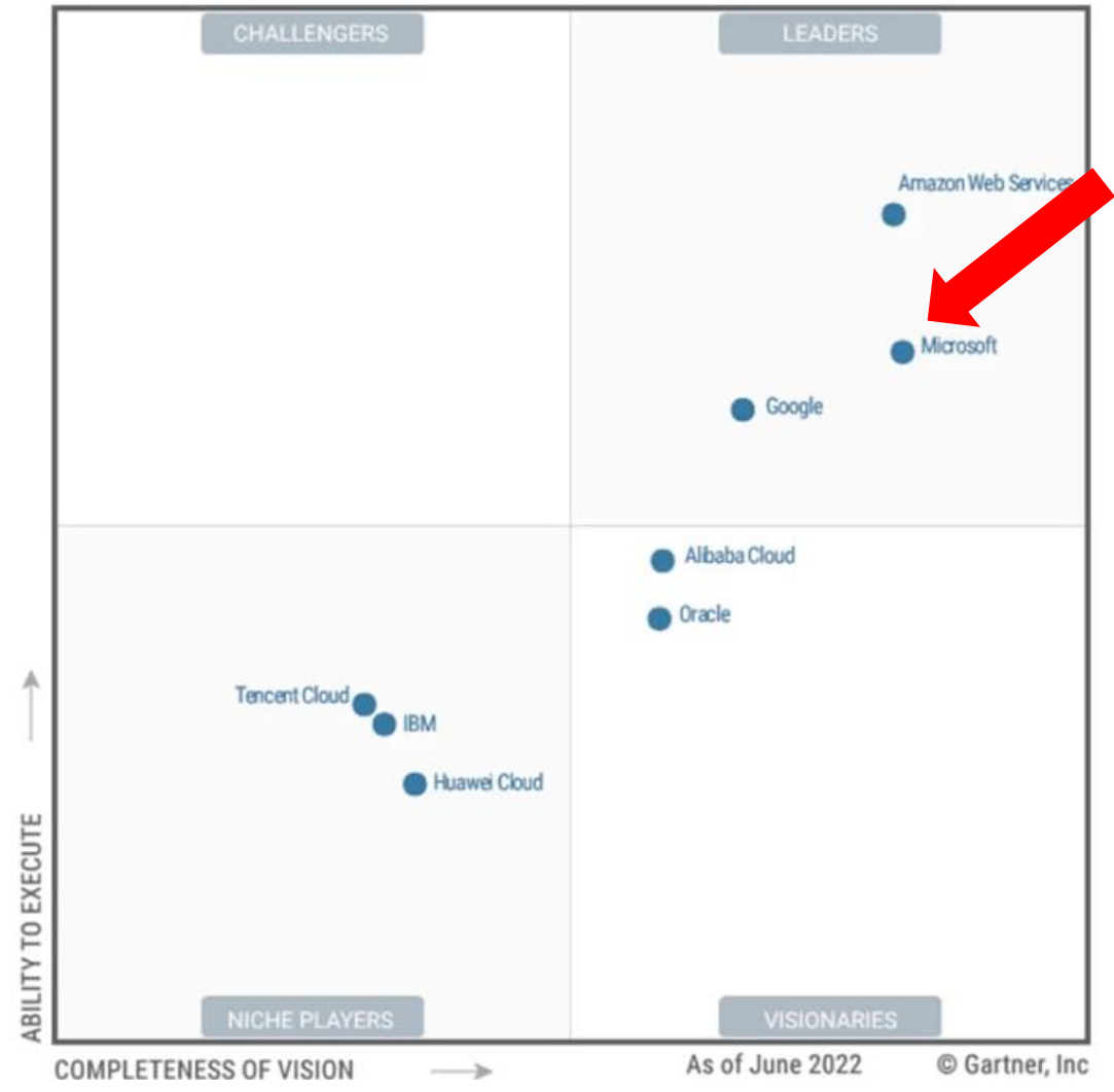
Cloud Infrastructure and Platform Services