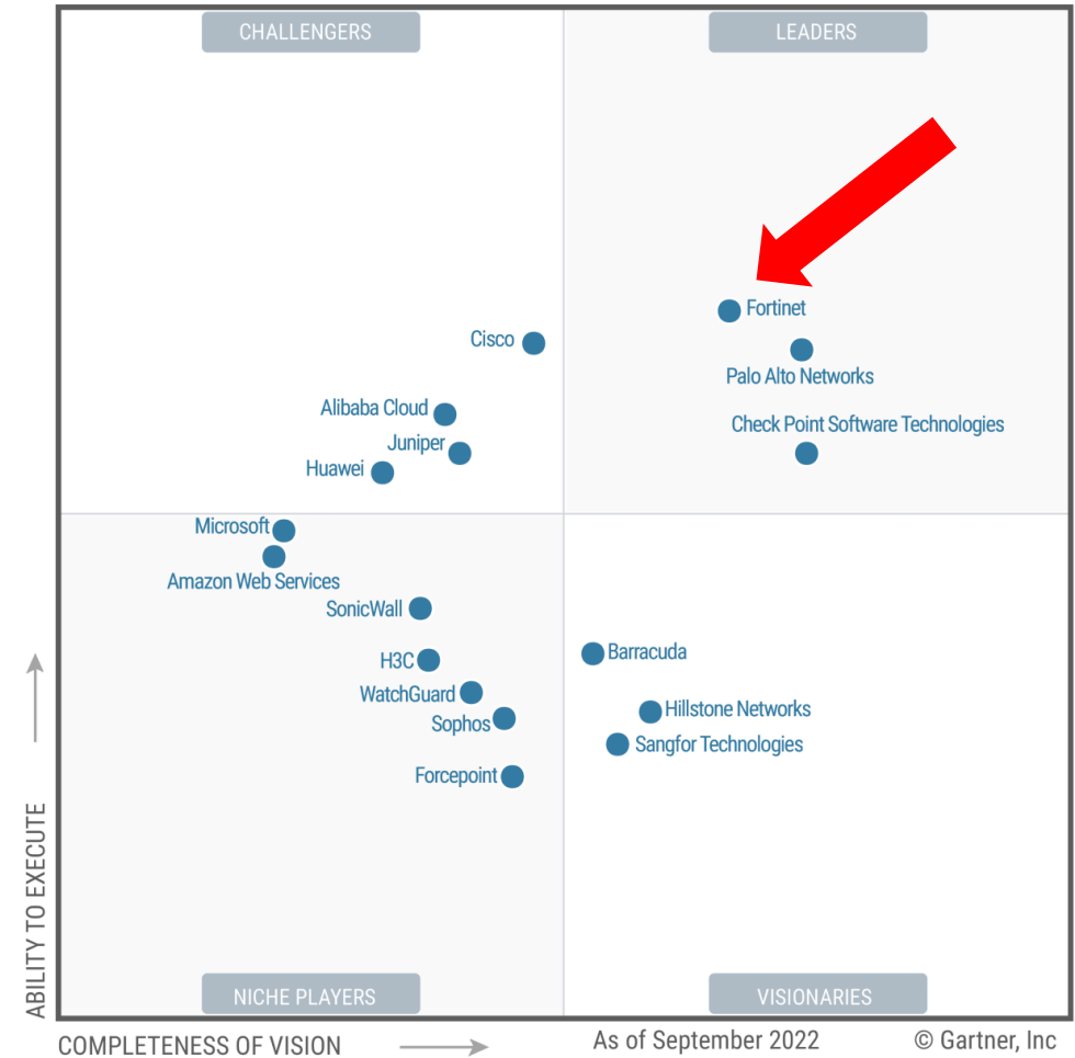
Network firewalls 2022