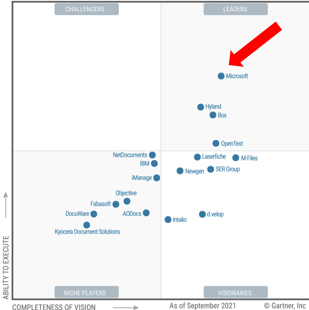
Content Services Platforms